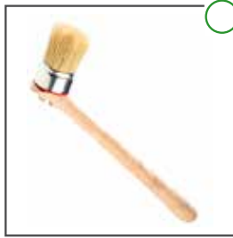
Spezialpinsel für Montagepaste