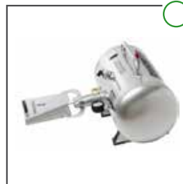
Aufpumphilfe Auto Booster