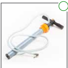
Pumpe für Reifendichtmittel