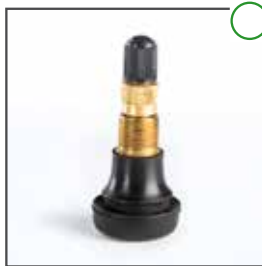
LKW Ventil TR 618 (Snap In)