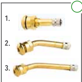
1. LKW Ventil 41 MS 2. LKW Ventil 70 MS 3. LKW Ventil 90 MS