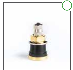
LKW Ventil 32 MS