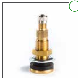
LKW Ventil TR 618 (Schraubventil)