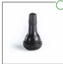
Ventil TR 415