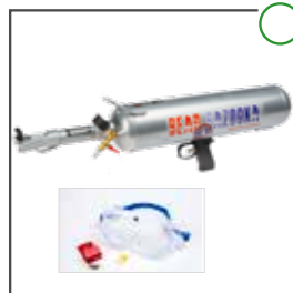
Bead Bazooka XL